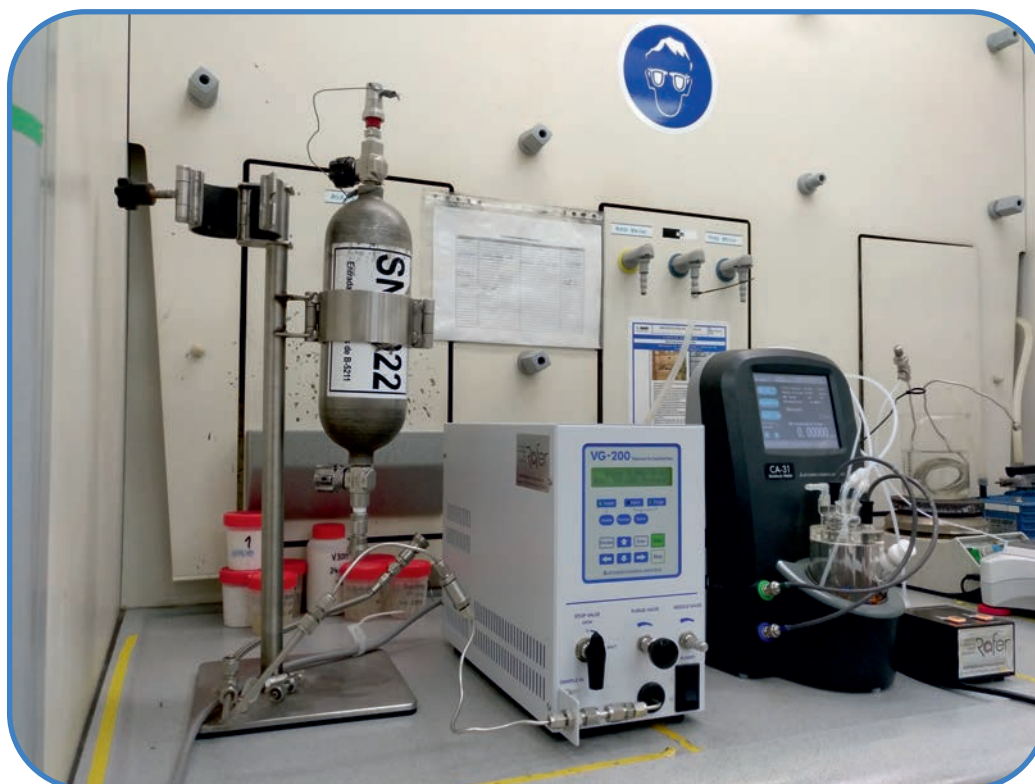
Figura 1 - VG-200 asociado a CA-31 celda reactivo único y dosificador/evacuado de reactivo KF-SD

La presente aplicación describe la determinación del contenido de agua en propano licuado (LPG), mediante la combinación de la técnica de coulombimetría Karl Fischer asociada al vaporizador automatizado VG-200.