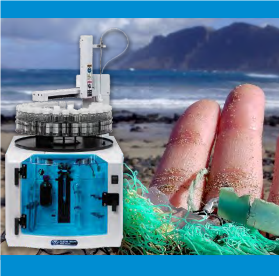
ANALIZADOR TOC TORCH